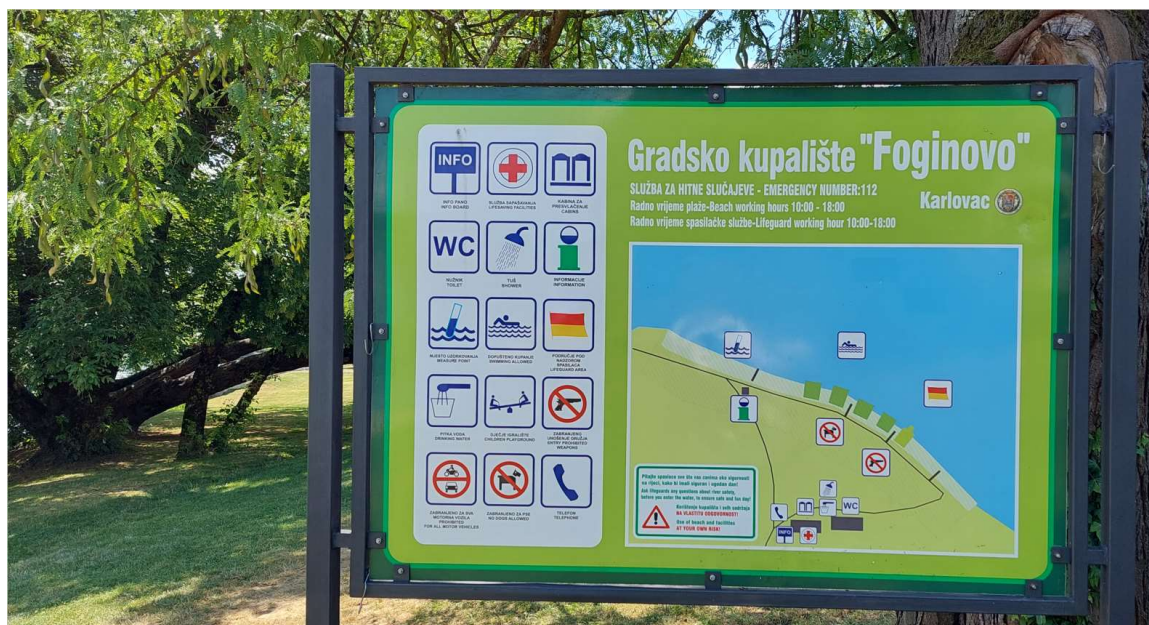
Slika 4. Obavijesna ploča na kupalištu Korana Foginovo, u Karlovcu

Jedinice lokalne samouprave također obavješćuju kupce o kakvoći voda za kupanje i poduzetim mjerama upravljanja korištenjem svojih mrežnih stranica, javnih sredstava priopćavanja i neposredno putem obavijesnih ploča na lokaciji kupališta. Također, u slučaju privremene obustave kupanja na nekoj plaži, postavlja se odgovarajuća obavijesna ploča kojom se upozorava kupce na preporuku da se ne kupaju ili na zabranu kupanja.