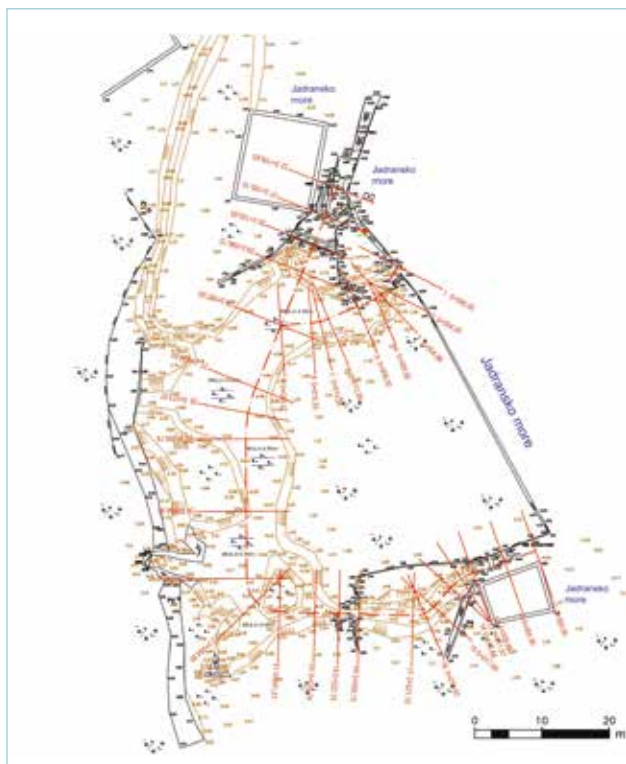
Slika 4: Situacija izvorišta Blaz (prema Licul, 2015.)