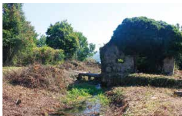
Slika 1: Pogled na presušeno jezerce izvora Blaz: a) lijevi krak; b) desni krak