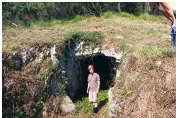
Slika 3: Tunel- drenažna galerija, gore- u tunelu, dolje- ulaz u tunel (snimila: M. Oštrić)