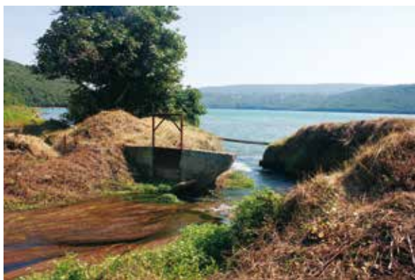
Slika 2: Napušteni i zapušteni mjerni objekti na izvorištu Blaz

Na samom su početku rađena hidrološka i hidrogeološka istraživanja, koja su kasnije bila temelj svim daljnjim istraživanjima. U tom početnom razdoblju izgrađeni su mjerni uređaji – betonska brana sa pravokutnim preljevom tipa Poncelot na istočnom kanalu i betonski prag širokog preljeva na zapadnom kanalu (DHMZ, 1968.). Ovi mjerni uređaji danas su potpuno zapušteni i izvan funkcije ( slika 2 ).