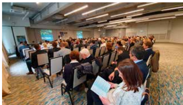
Sudionici 7. hrvatske konferencije o vodama