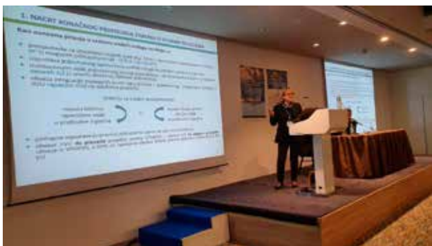
Elizabeta Kos, pomoćnica ministra za vodno gospodarstvo i zaštitu mora