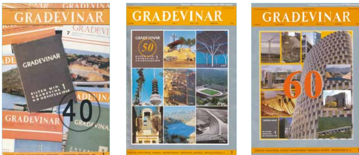
Naslovnice jubilarnih brojeva časopisa GRAĐEVINAR