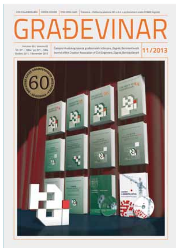
Naslovnica časopisa GRAĐEVINAR, broj 11/2013.

Čestitkama na ostvarenim rezultatima djelovanja i rada HSGI-a od 1953. do 2013., a posebno na redovitom izlaženju i kvaliteti časopisa GRAĐEVINAR od 1949. do 2013. pridružuju se i članovi Redakcijskog odbora i Izdavačkog savjeta časopisa Hrvatske vode.